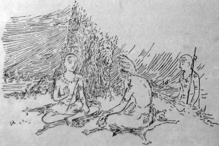
ஸ்ரீ சங்கரரும் வேதவியாஸரும்.

றன. எல்லா மதங்களுடைய பிரதிநிதிகளும் காசி சேஷத் திரத்தில் இருப்பார்கள். அந்தக் காலத்தில் மஹாபண்டி தர்கள் இருந்த ஸ்தானமாக அது இருந்தது. யாத்திரை பண்ணிக்கொண்டே பலபேர்கள் அங்குவந்து தங்கி இருப் பார்கள். நம்முடைய தேசத்தில் எத்தனை ஜாதி, எத்தனை மதங்கள், எத்தனை பாஷைகள் இருக்கின்றனவோ அவ்வள வையும் அங்கே பார்க்கலாம். ஆகையால் அங்கே போய்ப் பிரசாரம் செய்தால் லோகமுழுதும் பிரசாரமாகும் என்று ஸ்ரீ ஆசார்யரவர்கள் நினைத்தார்கள். பல தேசங்களில் உள்ள வைதிகர்கள் அங்கே இருந்தார்கள். அதனால் காசியில் பாஷ்யம் பண்ணினது லோகப்பிரசாரத்திற்கு ஏதுவாயிற்று. அங்கே பல மதஸ்தர்களுடைய கொள்கைகளை நிராகரணம் பண்ணி ஒளபநிஷதமான மதத்தை ஸ்தாபித்தார்.