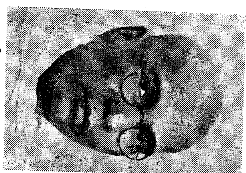
தமிழ்த்தொன்றல் திரு. வி. க.

திரு. வி. கவியாணை சுந்தரவாரர் ஓர் எளிய குடும்பத்தில் பிறந்து வளர்ந்து எளிய வாழ்வே வாழ்ந்தவர். பிறப்பும் வாழ்வும் எளிமையாக இருந்தபோதிலும், அவர்தம் எழுத்திலும் சொல் லிலும் செயலிலும் பெருமை பல விளங்கின. அவர் இணையற்ற எழுத்தாளர்; கேட்டார்ப் பிணிக் குடும்பேசாளர்; அறநெறி பிறழாச் செய லாளர். இதழ் ஆசிரியராகவும் நூலாசிரியராக வும் விளங்கி அவர் தமிழ் மொழிக்குச் சிறந்த எழுத்துப்பணி புரிந்துள்ளார்; அவருடைய எழுத்துக்கள் இளைஞரின் உள்ளங்களைக் கவர்ந்தி. அவர்களின் வாழ்க்கையைத் துலக் கியது. அவர்தம் தமிழ்தடை பீடும் பெருமித் மும் வாய்ந்தது. பேச்சுத் துறையிலும் அவர் ஆற்றிய தொண்டு அளப்பரிது. அவர் சென்று பேசாத ஊர் இல்லை; ஏறாது மேடை இல்லை எனலாம் சமயம், இலக்கியம், அரசியல், சமுதாயச் சீர்திருத்தம் முதலான எல்லாத் துறையும் அவர்தம் பேச்சுத் தொண்டால் பயலை பெற்றன.